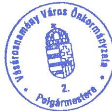
Filep Sándor polgármester